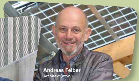
Andreas Felber Architekt (atool)

Mit einer guten Isolation und einer kontrollierten Lüftungsanlage wurde darauf geachtet, dass die Gebäudehülle möglichst wenig Energie verliert. Für Heizung und Warmwasser ist mit einer Luft-Wärmepumpe auf eine fossilfreie Lösung gesetzt worden.